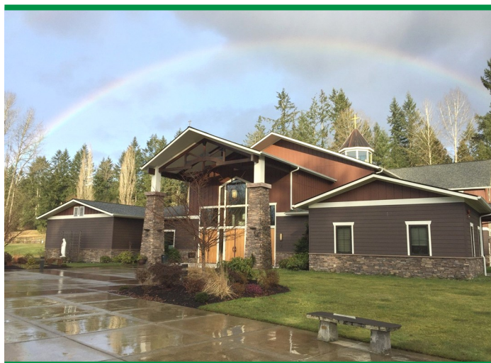
SANTA TERESA DE CALCUTA WWW.SAINTTTERESACALCUTTA.ORG