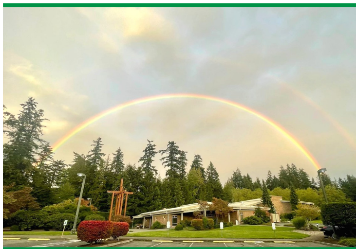
SAN BRENDAN WWW.PARISH.SAINTBRENDAN.ORG